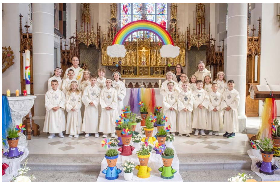
Die Erstkommunionkinder mit Erich Hausheer, Thomas Sidler und Regula Soom.